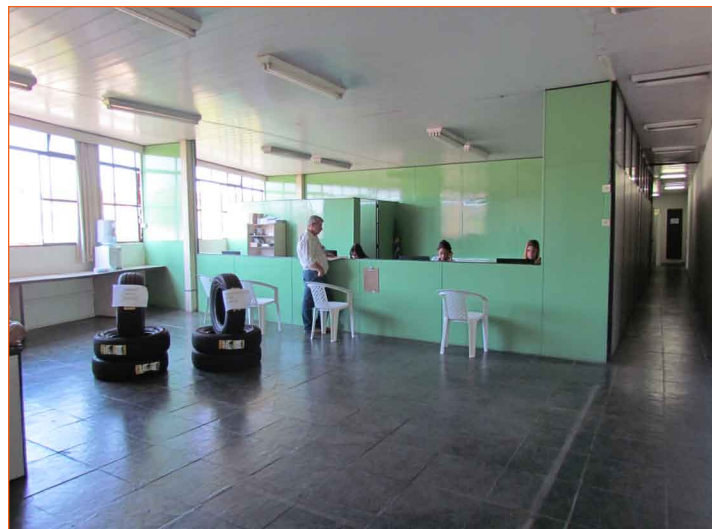
Nova sede garante espaço e conforto para operadores de transporte escolar e fretado.

Em busca do melhor atendimento para os operadores de transporte escolar e fretado, foi inaugurada em outubro a nova sede da Cooperminas, Fecominas e Atep. O novo espaço funciona no mesmo endereço, porém no andar de cima.